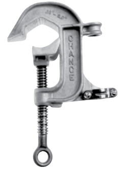
C6002256 Cuerpo de aluminio, Mordazas dentadas, Perno de bronce con ojal con rosca Acme Roscado para Casquillo roscado UNC de 5/8-11