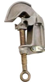
T6003203 Cuerpo de aluminio, Mordazas lisas, Perno de bronce con ojal con rosca Acme Roscado para Casquillo roscado UNC de 5/8-11