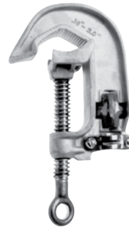
C6002282 Cuerpo de aluminio, Mordazas dentadas, Perno de bronce con ojal con rosca Acme Terminal de bronce tipo a presión