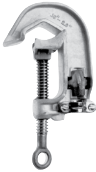
C6002281 Cuerpo de aluminio, Mordazas lisas, Perno de bronce con ojal con rosca Acme Terminal de bronce tipo a presión