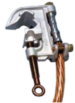
T6000658 Cuerpo de aluminio, Mordazas lisas, Perno de bronce con ojal con rosca Acme Perforado para Casquillo roscado UNC de 5/8-11