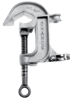
C6002255 Cuerpo de aluminio, Mordazas lisas, Perno de bronce con ojal con rosca Acme Roscado para Casquillo roscado UNC de 5/8-11